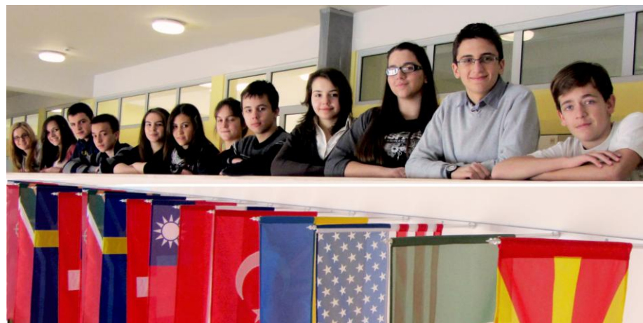
Katër gjenerata të reja shfrytëzues të bursave

Presidenti i ndjerë Boris Trajkovski ishte mik i NOVA-s.